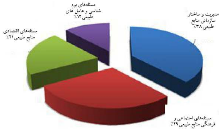
شکل ۲- میزان اهمیت معیارهای چهارگانه در مدیریت پایدار منابع طبیعی از نظر خبرگان.