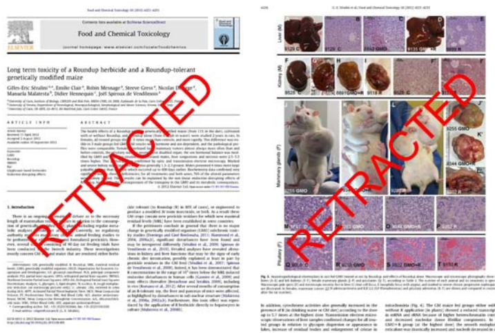
شکل ۳- مقاله رد شده سرالینی و همکاران (۲۴) که مخالفان تراریخت به آن استناد می‌کنند.

این مقاله توسط حمایت مالی هیچ شرکت خصوصی یا لابی‌گری هیچ نهادی نگاشته نشده است و هیئت پیشستیانی مالی به هیچ‌وجه در تهیه آن دخالت نداشته‌اند. در این مقاله آمده است که درک و افکار عمومی منفی کلی درباره استفاده از موجودات حاصل از مهندسی ژنتیک (محصول‌های تراریخت) در تولید غذا، هم در کشورهای توسعه یافته و هم در کشورهای در حال توسعه، دشواری‌های شدیدی را برای تولید و تجاری‌سازی این محصولات ایجاد کرده است. تعدادی از مقاله‌های منتشر شده مباحثی را به راه انداخته‌اند که ادعا می‌کنند محصولات‌های تراریخت به دلیل برخی سازوکارهایی که تاکنون ناشناخته مانده‌اند، می‌توانند سبب بروز خطرهایی برای سلامتی مصرف‌کننده شوند. در این مقاله نشان داده شده است که برخی از مقاله‌هایی که به شدت بر دیدگاه عموم درباره محصولات‌های تراریخت تأثیر منفی گذاشته‌اند و حتی به اقدام‌های سیاسی مانند تحریم محصولات‌های تراریخت دامن زده‌اند، کاستی‌های مشترکی در ارزیابی آماری داده‌ها دارند و سپس با توضیح علت این کاستی‌ها، نتیجه‌گیری کرده‌اند که داده‌های ارائه شده در این مقاله‌ها هیچ‌گونه شواهدی از آسیب‌زایی محصولات‌های تراریخت نشان نمی‌دهند. آن‌ها در نتیجه‌گیری مقاله اظهار شوریختی کرده‌اند که مقاله‌ای مانند، مقاله سرالینی با وجود این‌که برگشت داده شده است، بحث عمومی به راه می‌اندازد و سبب ایجاد احساس ترس طولانی‌مدت می‌شود. نویسندگان این مقاله اعتقاد دارند که سیاست‌گذاران، رسانه‌ها و عموم مردم نباید به تک مقاله‌هایی که درباره ملاحظه‌های مربوط به سلامت محصولات‌های تراریخت وجود دارد توجه کنند مگر این‌که از تجزیه‌های معتبر آماری برخوردار بوده و بررسی‌های مستقل دیگری نتایج آن‌ها را تأیید کرده باشند (۲۲).